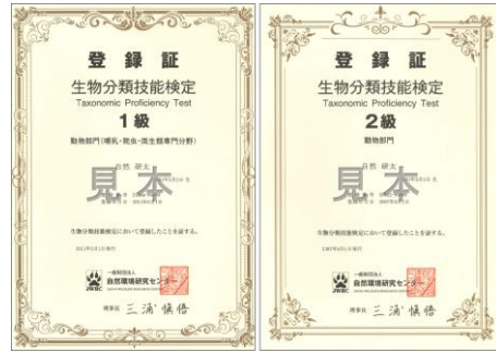
賞状型登録証の例