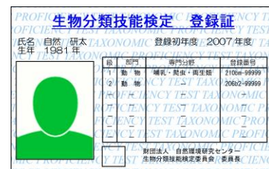
携帯型登録証の例